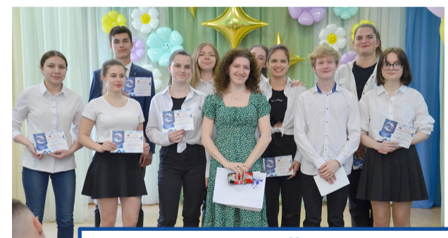
ЗВЁЗДЫ СТУДЕНЧЕСКОЙ СЦЕНЫ