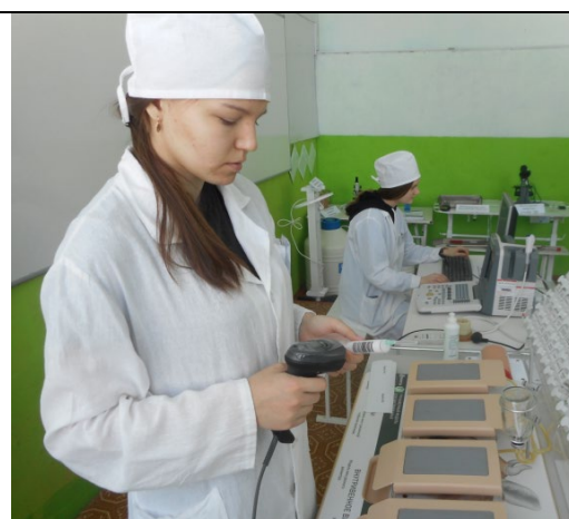
Работа на интерактивно-тренажёрном комплексе «Фармаколог»

Имеются кабинеты и лаборатории с необходимым оборудованием, которое позволяет проводить лабораторно-практические занятия и учебную практику по дисциплинам и профессиональным модулям.