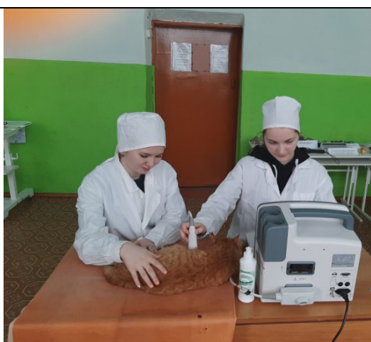
Ультразвуковое исследование кошки

С 2019 года в лабораторном корпусе техникума оборудована мастерская «Ветеринария». Она оснащена современным оборудованием. Приобрели по гранту ветеринарный ультразвуковой диагностический аппарат WED -9618V, гематологический анализатор BC-2800 Vet, микроскопы Levenhuk 720B, интерактивный тренажерный комплекс, тренажер для проведения сердечно-легочной реанимации у собак, станок для фиксации животных, анализаторы качества молока «Эксперт Стандарт», «Клевер 2», «Лактан 1-4», люминоскоп «Филин», овоскоп Он-10, проекционный трихинеллоскоп «Стейк» и другое ветеринарное оборудование. Студенты с интересом изучают ветеринарные приборы. Оборудование закуплено на сумму более двух миллионов рублей.