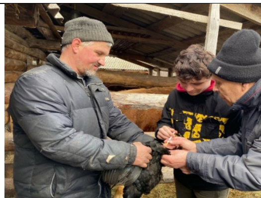
Вакцинация кур против гриппа

В этом учебном году студенты 3 и 4 курсов совместно с ветеринарными специалистами в хозяйствах Краснослободского района взяли 650 проб крови от коров, как на привязном, так и беспривязном содержании, для исследования на бруцеллез.