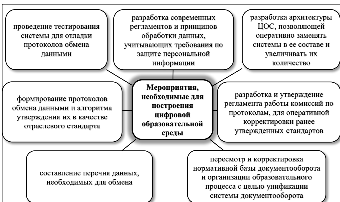
Рис. 1 – Мероприятия, необходимые для построения цифровой образовательной среды

информационных систем, предназначенных для обеспечения различных задач образовательного процесса. Сущность открытой системы проявляется в возможности, имеющейся у любого пользователя в процессе учебы или работы использовать любые информационные системы в ЦОС (рис. 1.). При этом перечень систем может меняться со временем, а ее логика формирования связана с соблюдением предусмотренных условий и правил. Среда предполагает наше окружение, включающее в себя разные элементы, среди которых выделяются согласованные, конкурирующие, дублирующие и антагонистичные. Среда в отличие от системы характеризуется динамичностью развития. Элементы среды могут также меняться, заранее предсказать какие из них будут длительное время использоваться, а какие быстро станут не актуальными не представляется возможным. В свою очередь система разрабатывается под конкретные цели. Она включает совокупность элементов, которые связаны между собой. Продолжительность функционирования системы определяется грамотным проектированием внешних условий в проекте и темпом их изменения.