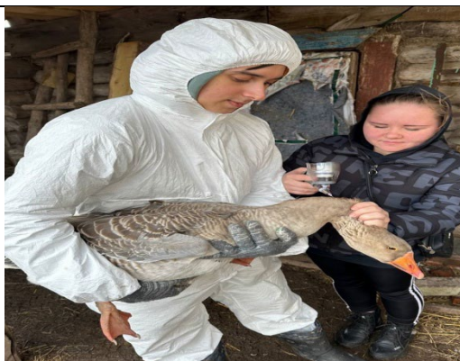
Вакцинация гусей против гриппа

В марте - апреле студенты 3 и 4-х курсов совместно с ветеринарными специалистами Краснослободской районной ветеринарной станции по борьбе с болезнями сельскохозяйственных животных проводили вакцинацию птицы против гриппа на личных подворьях граждан в селах: Новая Карьга, Колопино, Новое Синдрово, Старое Зубарёво, Гумны и других, в посёлке Преображенский Краснослободского района. Всего, было привито более 1000 голов птицы против гриппа.