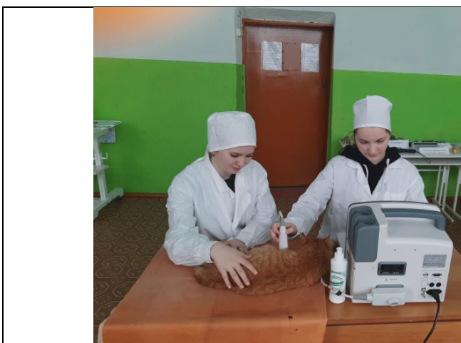
Ультразвуковое исследование кошки

С 2019 года в лабораторном корпусе техникума оборудована мастерская «Ветеринария». Она оснащена современным оборудованием. Приобрели по гранту ветеринарный ультразвуковой диагностический аппарат WED -9618V, гематологический анализатор BC-2800 Vet, микроскопы Levenhuk 720B, интерактивный тренажёрный комплекс, тренажёр для проведения сердечно-легочной реанимации у собак, станок для фиксации животных, анализаторы качества молока «Эксперт Стандарт», «Клевер 2», «Лактан 1-4», люминоскоп «Филин», овоскоп Он-10, проекционный трихинеллоскоп «Стейк» и другое ветеринарное оборудование. Студенты с интересом изучают ветеринарные приборы. Оборудование закуплено на сумму более двух миллионов рублей.